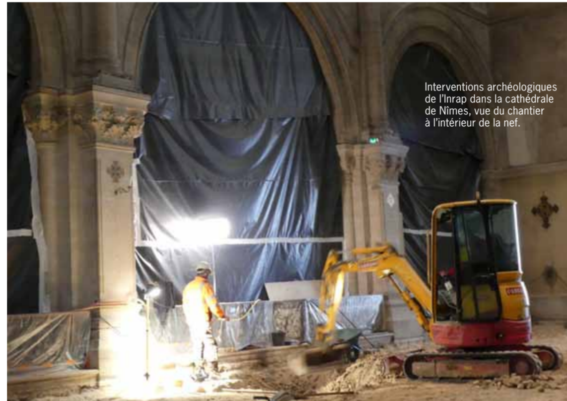
Interventions archéologiques de l'Inrap dans la cathédrale de Nîmes, vue du chantier à l'intérieur de la nef.